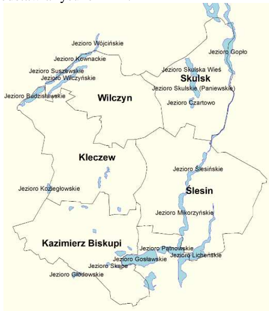
Rysunek 2. Jeziora na obszarze LGD „MIĘDZY LUDŹMI I JEZIORAMI”

Obszar gmin należących do LGD „MIĘDZY LUDŹMI I JEZIORAMI” jest spójny geograficznie - należy do makroregionu Pojezierze Wielkopolskie w mezoregionie Pojezierze Gnieźnieńskie i został ukształtowany w poznańskiej fazie zlodowacenia wiślanego 1 . Wschodnia część Pojezierza Gnieźnieńskiego nazywana jest Pojezierzem Mogileńskim i charakteryzuje się skupieniem dużej liczby jezior rynnowych o przebiegu południkowym . Jeziora we wschodniej części obszaru LGD są zlokalizowane na przedłużeniu Rynny Gopła (Jezioro Ślesieńskie, Mikorzyńskie, Pątnowskie, Licheńskie i uchylone w stronę zachodnią Jezioro Gosławickie). Wody tej rynny zostały w latach 50. XX w. połączone żeglownym kanałem sięgającym od Warty w okolicach Konina do Jeziora Gopło. Równoległe do Rynny Gopła położone są Jezioro Skulskie i Jezioro Skulska Wieś. Na północno-zachodnich krańcach gmin Kleczew i Wilczyn przebiega kolejna rynna, w której zlokalizowane są Jezioro Budziszawskie i Wilczyńskie. Lokalizację i nazwy jezior z terenu LGD „MIĘDZY LUDŹMI I JEZIORAMI” przedstawia rysunek nr 2.