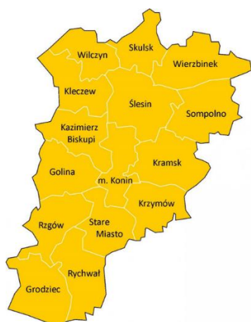
a. Powiat koniński

Lokalną Grupę Działania (LGD) „MIĘDZY LUDŹMI I JEZIORAMI” tworzy pięć gmin ze wschodniej części województwa wielkopolskiego: dwie gminy miejsko-wiejskie: Kleczew i Ślesin , oraz trzy gminy wiejskie: Kazimierz Biskupi , Skulsk i Wilczyn . Zlokalizowane są one w północnej części powiatu konińskiego, zajmując łącznie jedną trzecią powierzchni (34%) powiatu (rysunek 1). Wszystkie gminy, których obszar jest objęty LSR nie są członkami innych LGD. Obszar LGD od północy graniczy z województwem kujawsko-pomorskim, z powiatami (wymieniając od zachodu): mogileńskim, inowrocławskim i radziejowskim, od zachodu z powiatem słupeckim, natomiast południowa i wschodnia granica obszaru LGD sąsiaduje z gminami należącymi do powiatu konińskiego. Gmina Kazimierz Biskupi i Ślesin bezpośrednio sąsiadują z miastem Konin .