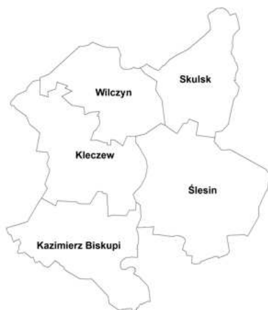
b. LGD „MIĘDZY LUDŹMI I JEZIORAMI”