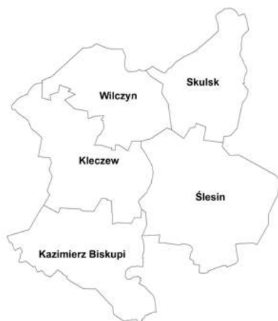
b. LGD „MIĘDZY LUDŹMI I JEZIORAMI”