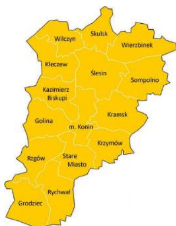
a. Powiat koniński

Lokalną Grupę Działania (LGD) „MIĘDZY LUDŹMI I JEZIORAMI” tworzy pięć gmin ze wschodniej części województwa wielkopolskiego: dwie gminy miejsko-wiejskie: Kleczew i Ślesin , oraz trzy gminy wiejskie: Kazimierz Biskupi , Skulsk i Wilczyn . Zlokalizowane są one w północnej części powiatu konińskiego, zajmując łącznie jedną trzecią powierzchni (34%) powiatu (rysunek 1). Wszystkie gminy, których obszar jest objęty LSR nie są członkami innych LGD. Obszar LGD od północy graniczy z województwem kujawsko-pomorskim, z powiatami (wymieniając od zachodu): mogileńskim, inowrocławskim i radziejowskim, od zachodu z powiatem słupeckim, natomiast południowa i wschodnia granica obszaru LGD sąsiaduje z gminami należącymi do powiatu konińskiego. Gmina Kazimierz Biskupi i Ślesin bezpośrednio sąsiadują z miastem Konin.