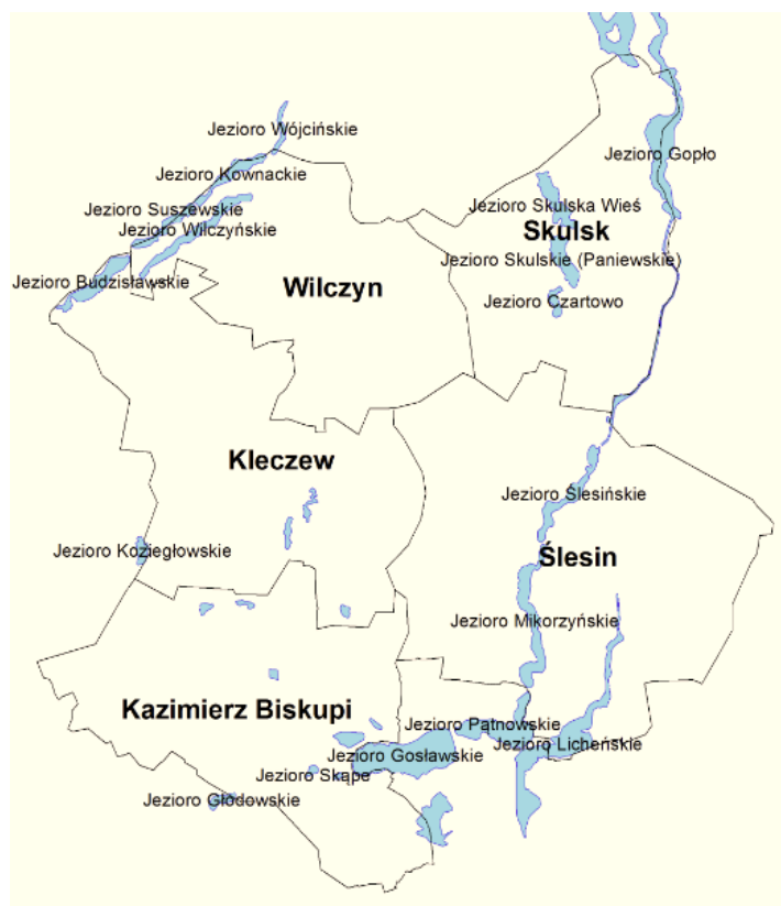
Rysunek 2. Jeziora na obszarze LGD „Między Ludźmi i Jeziorami”